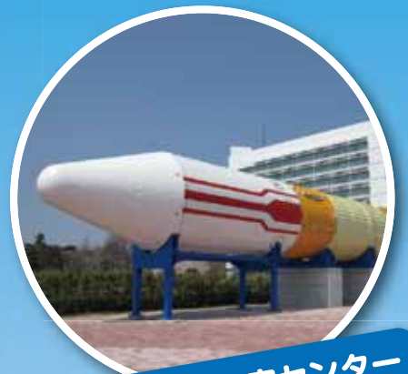
JAXA 筑波宇宙センター