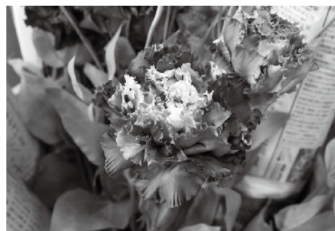
図1. 蕾切りによって生じた「着色ムラ」 花卉の中心部や縁に緑色が残る