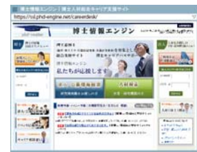
博士情報エンジン